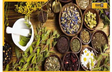
INDIA TO HOST ASEAN COUNTRIES CONFERENCE ON TRADITIONAL MEDICINES

(B) भारत 20 जुलाई 2023 को पारंपरिक दवाओं पर आसियान देशों के सम्मेलन की मेजबानी करेगा। यह सम्मेलन लगभग एक दशक के बाद नई दिल्ली में आयोजित किया जाएगा। सम्मेलन में कंबोडिया और वियतनाम समेत दस आसियान देश हिस्सा लेंगे। इसकी मेजबानी विदेश मंत्रालय, आसियान में भारतीय मिशन और आसियान सचिवालय के सहयोग से आयुष मंत्रालय द्वारा की जाएगी।